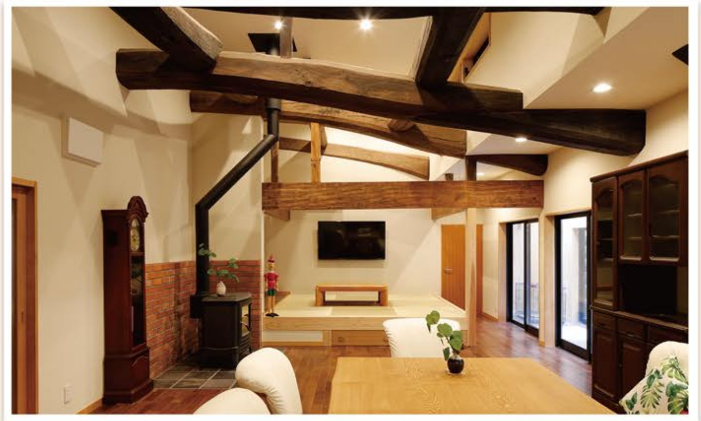
北側の暗く使っていない部屋を明るく有効に使える部屋にし、低かった天井を取っ払い梁を出し広々とした空間に仕上げました。また、古い空間の中にも現代の使い勝手の良い設備を使用し、今の生活スタイルに合わせた間取りです。