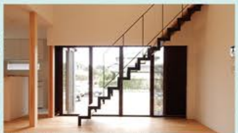
閉めると完全にプライバシーを守り、開ければ壮大な開放感。