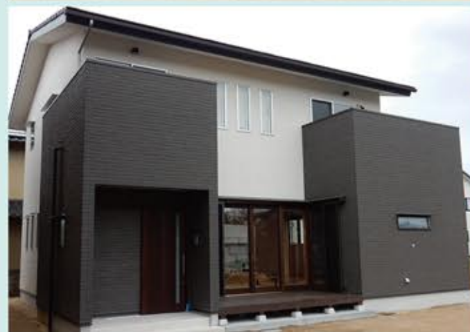
白と黒のコントラストが目立つ外観

ご主人のシンプルにスタイリッシュ、奥様の「かわいくのそれぞれの想いを取り入れました。建物の特徴は、総2階のシンプルな長方形の立面にインパクトを付ける為にキューブ状の凹凸をつけ、中に入れば大空間の吹き抜けに鉄骨階段をつけ、存在感の無いシンプルな作り。建具も天井と同じ高さにし、壁と一体化になるよう、又、黒と白のモノトーンでまとめ、スタイリッシュに仕上げました。