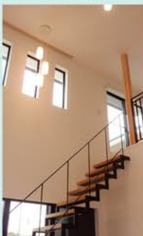
鉄骨階段も開放感を与えています