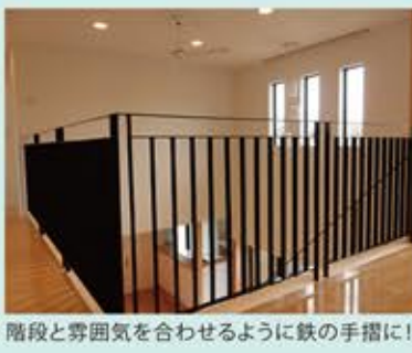
階段と雰囲気に合わせて鉄の手摺に!