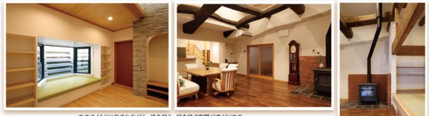
木のぬくもりに包まれながら、時を超え、時を紡ぐ空間が広がります。