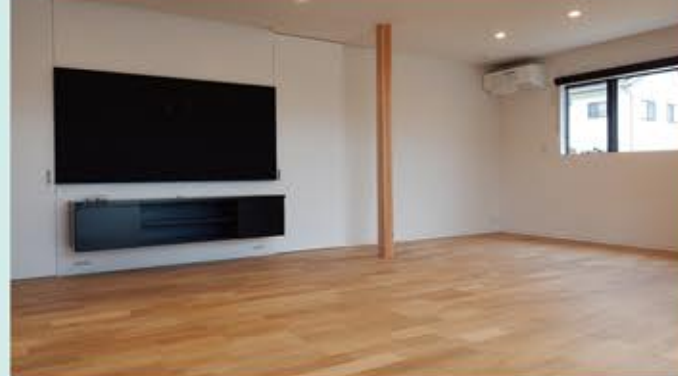
広々とシンプルな室内