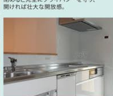
機能的で動きやすいシステムキッチン